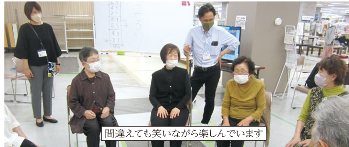
間違えても笑いながら楽しんでいます

ふれあい 医療生協には地域を変える力がある、私は確信している。私が17年前に移り住んだ地域は、昔は役場に小中学校と保育園、病院も4つあった。今は何も無い。町内の老人クラブは、「高齢化」のために解散していた。何のツテも無かったので、ヘルスメイトが開く食事会に参加し、その人々と医療生協の班を作った。班会の雑談で、「転入夫婦が始めたレストランの開店時間が11時変わった」「モーニングに年寄りばかりが来て帰らんき、もうけにならないがや」との話が来た。それならと班で始めたのが「古民家サロン」というモーニング。食事も人気だが、おばあちゃんがある場で作る「シバ餅」は最高。さらに毎回30分の話、実演コーナー。地域の坊さんや農業青年、趣味や特技の披露が楽しい。このサロンが4月で10周年を迎えた。地域で何が変わったか? 人の集まる「場」とネットワークが広がった。何より、何でも頼める楽しい集団が生まれた。そして、老人クラブが再開し、地域の新しいまつりも始まるうとしている。